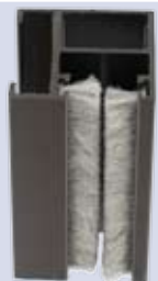
Coulisse clips 28 avec brosse