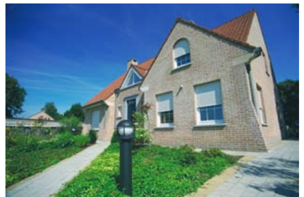
Volets roulants traditionnelles