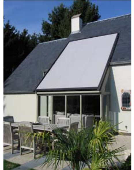
Protection solaire véranda