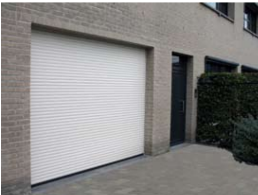
Volets roulants de garages