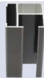
Coulisse clips 28