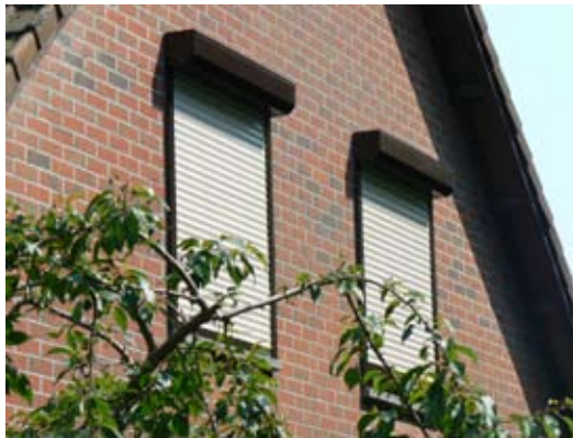
Volets roulants mini caisson